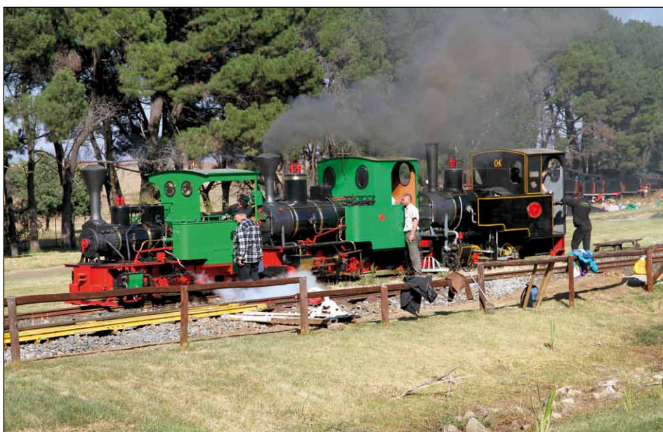
Nákladní vlak ve stylu našich lesních železnic tu doposud vypraven nebyl. Prý příští rok. A tak se tři zatopené lokomotivy Orenstein & Koppel zatím vyhřívají na sluníčku a čekají na odpolední vlak s vojenským materiálem.

ale i Němci a další, převážně společensky vysoce postavení lidé, pro které se pára stala koníčkem a Sandstone místem odpočinku. Ti také tvoří lokomotivní čety.