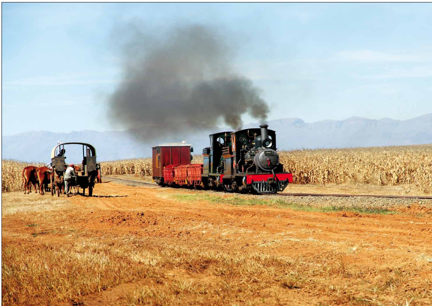
Farma Sandstone leží na úpatí Dračích hor v nadmořské výšce 1 500 m, ale dvě lokomotivy (Falcon) s nákladním vlakem dýchavičností netrpí. Jinak zde v květnu již panuje příjemný podzim a začíná sklizeň kukuřice.

telnou atmosféru starých časů. Železniční skupina absolvuje denně přibližně čtyři jízdy různými vlaky s přestávkou na oběd. V čele vlaků se střídají všechny lokomotivy, které jsou k dispozici. Z farmy vycházejí dvě samostatné úzkorozchodné dráhy (2 ft), jedna na jih, dlouhá asi pět kilometrů, druhá na severovýchod, dlouhá asi deset kilometrů. Obě tratě jsou zakončeny smyčkou umožňující obrát celých souprav k jízdě nazpět. Vlaky jsou sestaveny buď jako nákladní, smíšené, nebo osobní a jsou taženy jedním nebo více stroji. Nákladní vlaky jsou pokaždé sestaveny jinak, samozřejmě ložené a přepravují buď zemědělské stroje, auta, nebo vojenskou techniku.